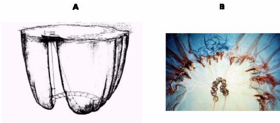
Figura 5: (A) Operação da rede de cerco em águas rasas. (B) A é fechada no fundo por cabos que passam por anilhas da traha inferior da rede.