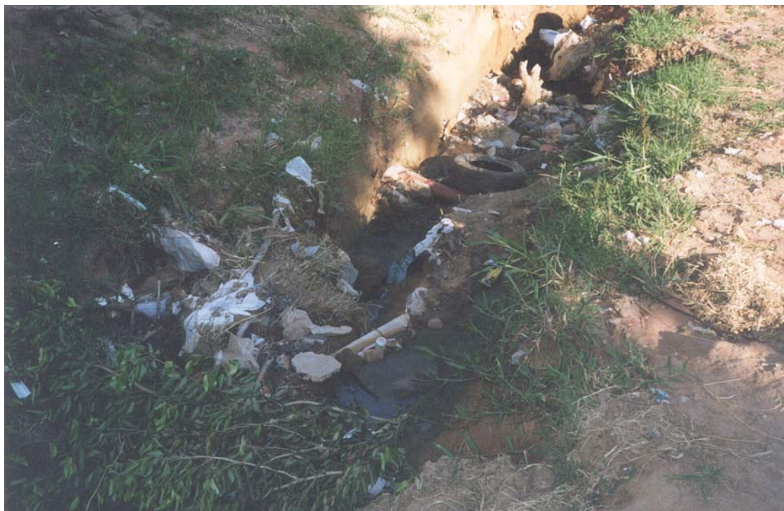
Foto de rua que dá acesso à escola realizada pela aluna Felisienne em 22/11/2001.

saneamento básico. As ruas que dão acesso à escola pesquisada, por exemplo, são de terra 99 e o esgoto “corre a céu aberto”.