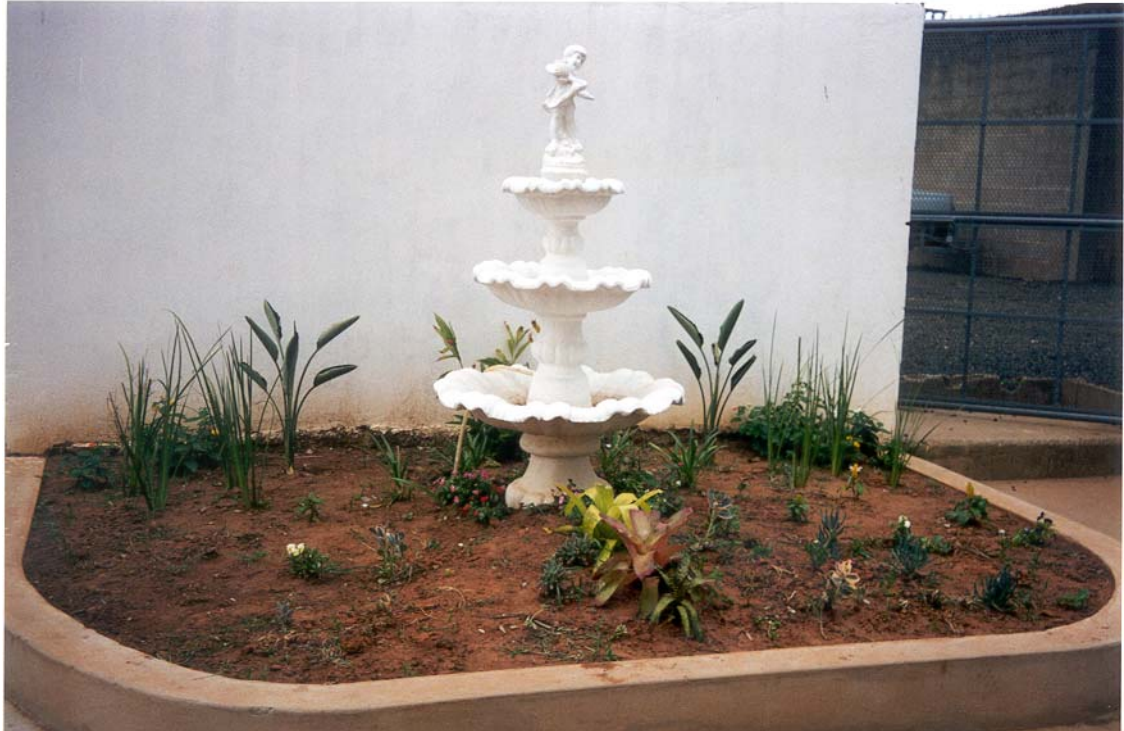
Foto realizada por mim no final do ano de 2002, do mesmo local agora com o jardim idealizado pela equipe pedagógica da escola.