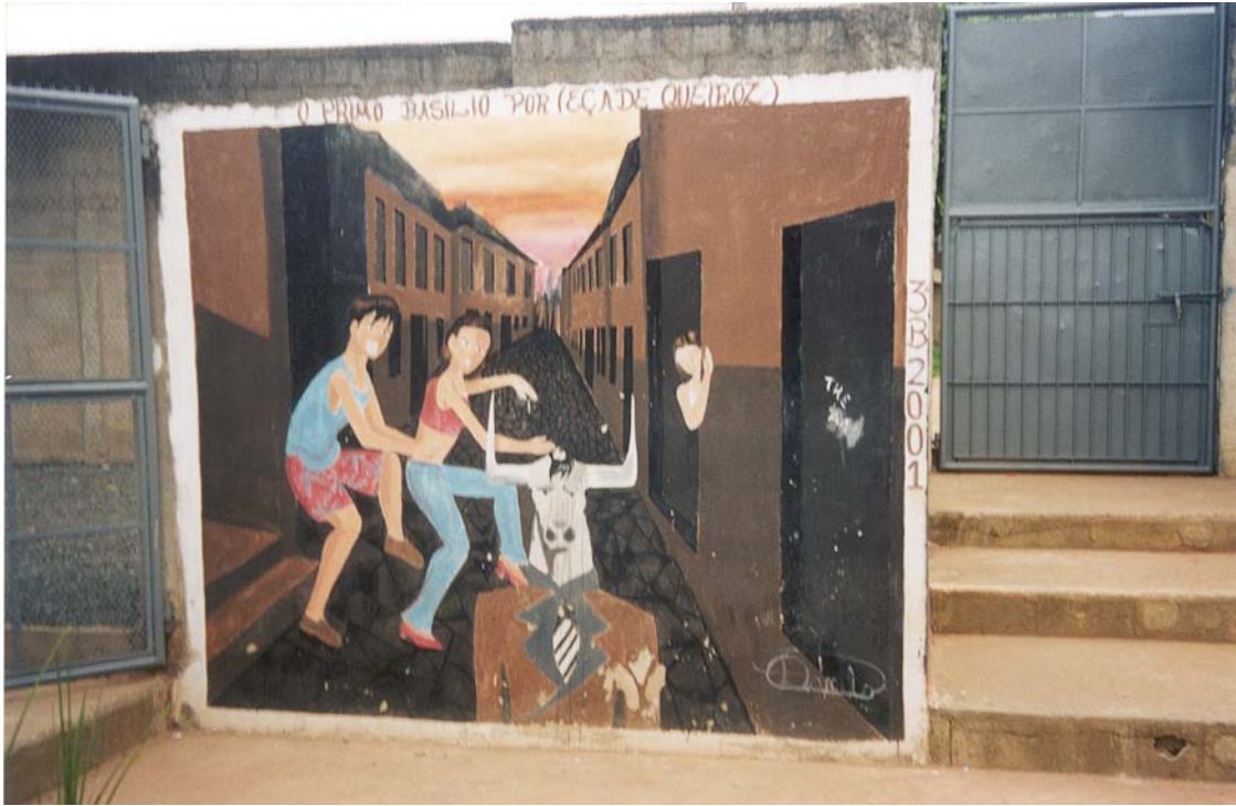
Foto realizada por mim de uma das pinturas feitas pelos alunos dentro do projeto de grafiteagem proposto pela coordenadora. Esse quadro foi realizado a partir da leitura do livro “O Primo Basílio” de Eça de Queiroz.