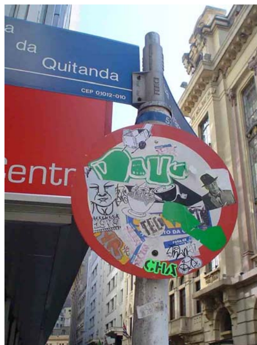
Fotos 7 e 8: Stickers em semáforo e placa de trânsito no centro da cidade.

As relações entre pixadores e grafiteiros são, também, bastante ambíguas e não muito bem definidas. Conforme já foi dito anteriormente, há grafiteiros-pixadores