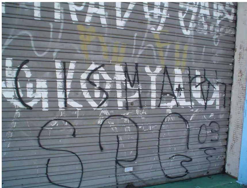
Foto 9: Em Cidade Ademar, o motivo ou o sinal de conflitos na pixação: o “atropelo”.

Alguns afirmaram que atropelam os grafites conhecidos como comerciais, porque, para eles, não seriam grafites de verdade, pois foram pagos e feitos com autorização: “são como outdoors”, ressaltou um pixador.