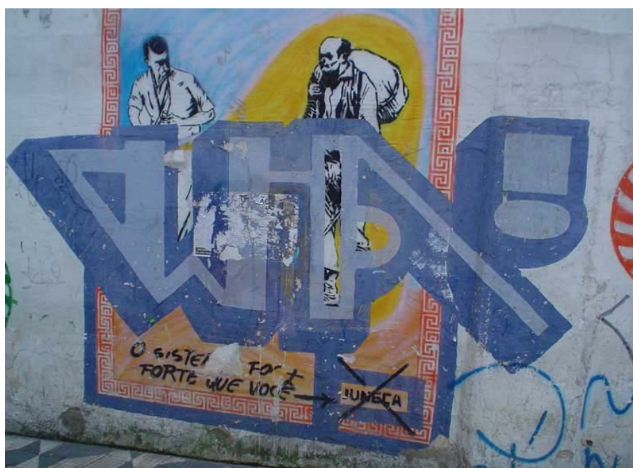
Foto 10: Grafite de Juneca no centro da cidade “atropelado” por grapixo (bomber), na parte de baixo, à direita: a assinatura de Juneca riscada e à esquerda, apesar da parede descascada, pode-se ler: “O sistema foi mais forte que você”.