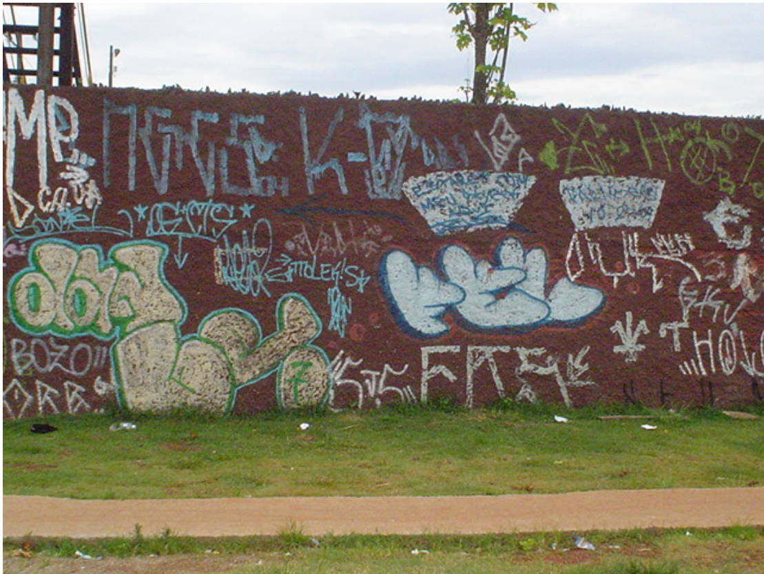
Foto 6: Neste muro, em uma praça onde pixadores costumam encontrar-se no bairro de Cidade Ademar, nota-se a presença de diferentes estilos: grapixos , tags e as típicas pixações paulistanas .